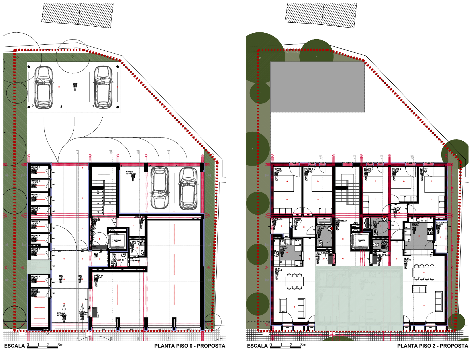
ESCALA 0 1 2 3m PLANTA PISO 0 - PROPOSTA